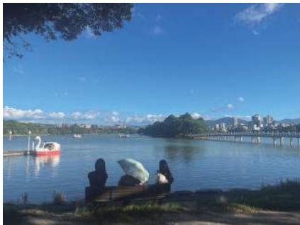
図9 池を縦断する橋と緑豊かな島