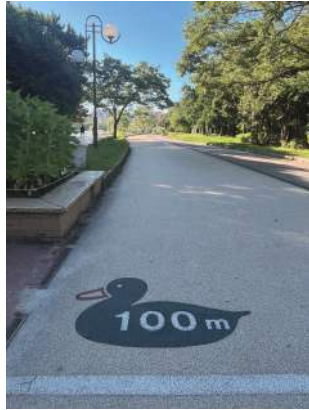
図5 一周2kmのランニングコースに記された距離表示