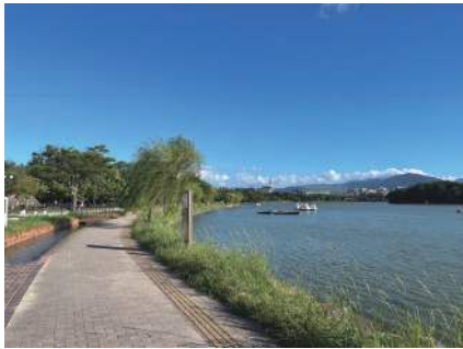
図8 池を囲む回遊性のある散策路