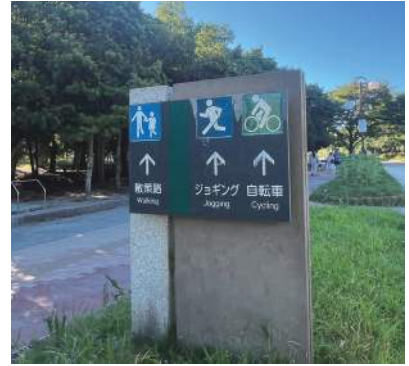
図6 走行路を示した案内板