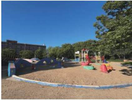
図4 大規模な遊具のあるくじら公園