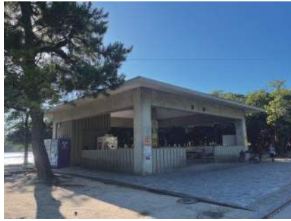
図2 道沿いに設置された休憩所