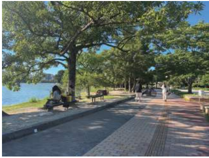
図1 散策路と道沿いの滞留空間