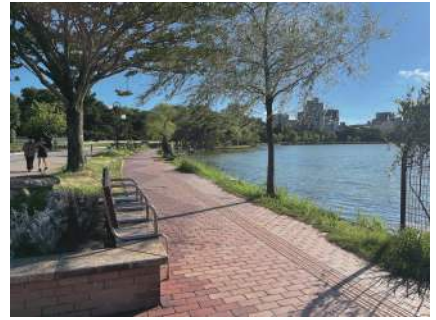
図3 池を眺めることのできるベンチ