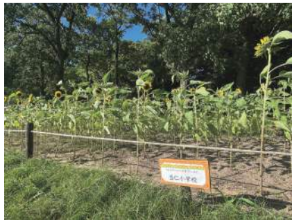
図10 市民が育てるひまわり